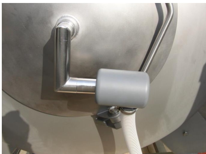
真空ホース脱着部は工具無しで脱着できます