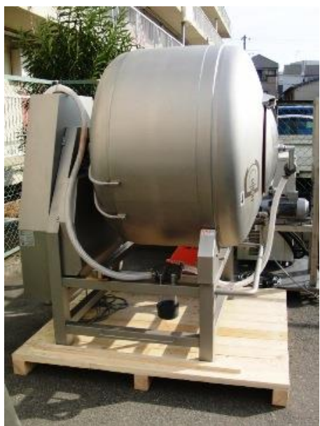
奥行き寸法が小さいので省スペースへの設置可能