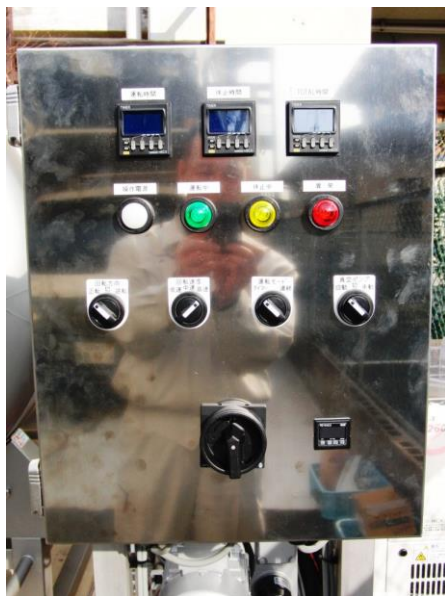
制御盤はステンレス製で全ての電気部品は入手し易い日本製です