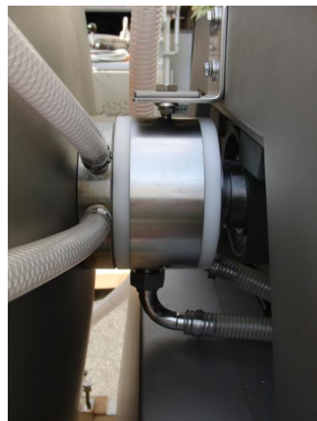
モーター動力を完全密封式シールを介して冷却液を送ります