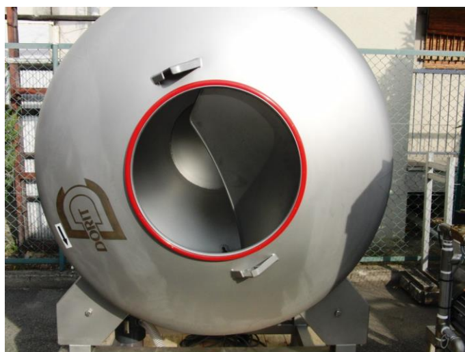
原料投入・排出口