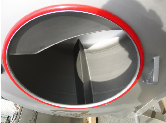
ドラム内部羽根形状